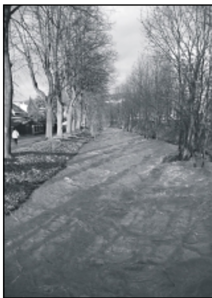
Snímky Bořivoje Kaliny z 31. března zachycují neobvykle zaplněné koryto Sitky v podvečer při průtoku Šternberkem a zásah hasičů v Dalově v domu pana Celého.

Nebezpečí povodní zahrozilo prvně v úterý 28. března v nočních hodinách ve Šternově, kdy vlivem deštivých srážek a především oteplení se rozlil potok Aleš, který obcí protéká. Bezprostředně došlo k ohrožení jednoho obytného domu. Situace byla nepřetržitě monitorována a v případě nutnosti byly připraveny písek a pytle k vytvoření hráze. Nedošlo však k nejhoršímu a situace se uklidnila v následujících dnech. Spodní voda se však objevila v několika obydlích.