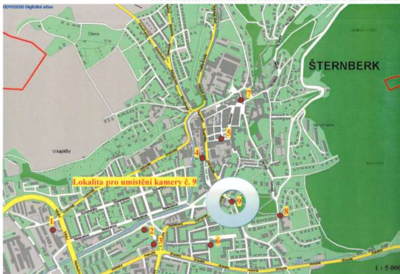
ROZMÍSTĚNÍ KAMEROVÝCH BODŮ VE MĚSTĚ ŠTERNBERK

V průběhu zkušebního provozu byla dále prověřena funkčnost a spolehlivost díla. Nové kamerové body byly instalovány bez závad a nedodělků, dílo bylo zhotoveno a zprovozněno v souladu se schválenou projektovou dokumentací. Dílo bylo předáno do trvalého provozu dne 1.12.2008.