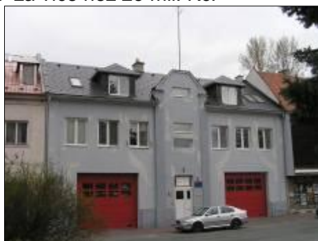
Hasičská zbrojnice po rekonstrukci

3.10. došlo na zasedání zastupitelstva ke změně politické koalice na šternberské radnici, byla provedena personální obměna v radě města a přijato bylo nové programové prohlášení rady do roku 2010. Zastupitelé schválili realizaci projektu domu pro matky nebo otce s dětmi v tísní a výstavbu chráněného bydlení v lokalitě u Tyršových sadů. 12.10. navštívil město ministr vnitra Ivan Langer při příležitosti Dne hasičů a integrovaného záchranného systému a šternberským hasičům slavnostně předal do užívání nově zrekonstruovanou hasičskou zbrojnici. 11. - 13.10. šternberští sportovní gymnasté reprezentovali město ve francouzském Lyonu na mezinárodním závodu ve šplhu na laně. Jednoznačným králem závodu byl Aleš Novák ze Šternberka - trojnásobný mistr ČR a držitel neoficiálního světového rekordu ve šplhu na 8 metrovém laně. Ve Šternberku byly vytipovány lokality vhodné pro výstavbu rozhleden. Radní zadali zpracování Strategie cestovního ruchu pro město Šternberk a Mikroregion Šternbersko na období do roku 2010. Městem se prohnala v noci z 22. na 23.10. silná vichřice, která vyvrátila v Tyršových sadech dva vzrostlé stromy. Na konci měsíce byla dokončena největší investice města v roce 2007 - výstavba kanalizace na Rýmařovském kopci za více než 25 mil. Kč.