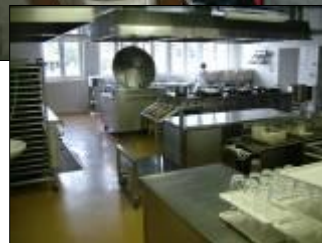
Školní jídelna Svatoplukova stav před a po rekonstrukci, nové zařízení kuchyně