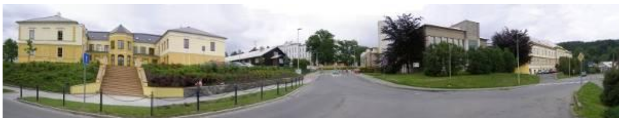
Základní škola Svatoplukova