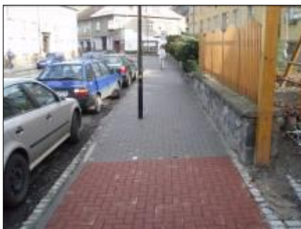
Chodník na ulici Náměstí Svobody, stav před a po rekonstrukci