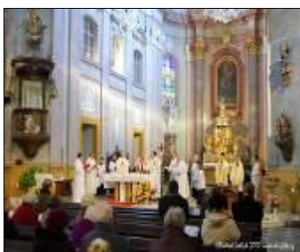
Interiér farního kostela