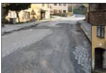
Ulice na Valech - stav před a po rekonstrukci

Od 1.4. začaly pracovat osadní výbory v Dalově, Těšíkově, Chabičově, Krakořicích, Dolním Žlebu a Lhotě. Starosta převzal 18.4. na Pražské hradě ocenění pro Šternberk, který byl nominován mezi první tři města v republice v soutěži o nejlepší přípravu programu regenerace městské památkové zóny. 23.4. se uskutečnilo setkání představitelů města s velkými zaměstnavateli a podnikateli ve Šternberku. Město Šternberk nastartovalo ojedinělý projekt podpory soukromých vlastníků objektů v městské památkové zóně ve Šternberku, na který vyčlenilo více než čtyři miliony korun. Dokončeny byly úpravy parkoviště nad gymnáziem a rekonstrukce části ulice Na Valech.