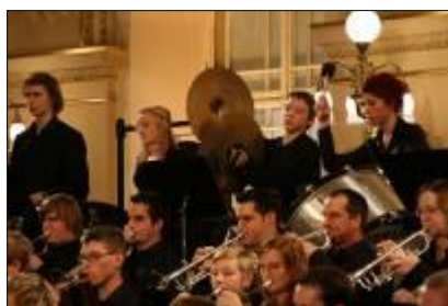
Harmonie na pražském Žofíně