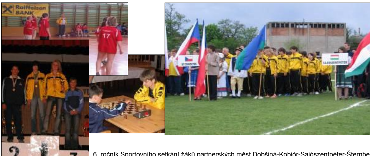
6. ročník Sportovního setkání žáků partnerských měst Dobšíná-Kobiór-Sajószentpéter-Šternberk