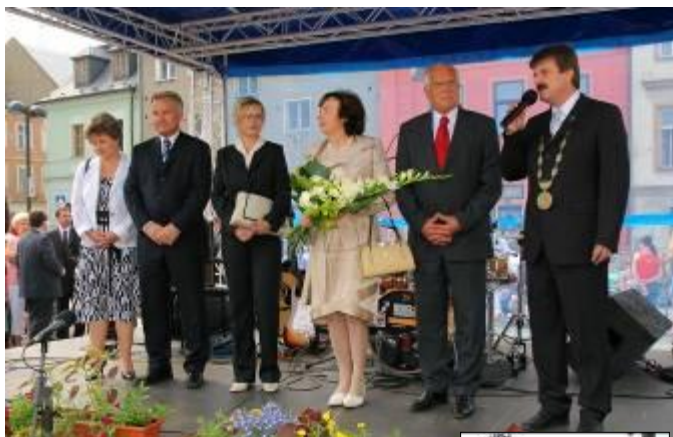
Prezident ČR na návštěvě ve Šternberku 14.6.2007