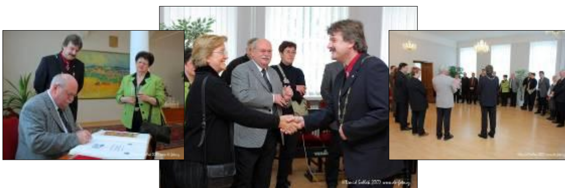
Přijetí delegace z partnerského města Lorsch (Německo)