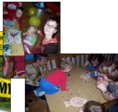
Mateřské centrum v DDM