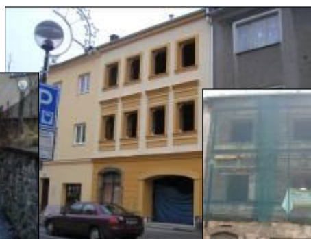
Objekt Čechova 5 – stav před a po rekonstrukci