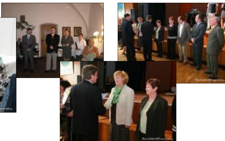
Den učitelů 27.3.2007