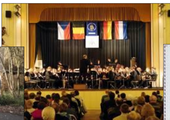
Harmonie na festivalu v Praze