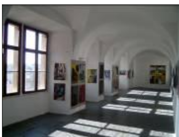
Výstavní prostory bývalého augustiniánského kláštera, prostory vnitřního nádvoří