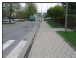
Ulice Nádražní stav před a po rekonstrukci