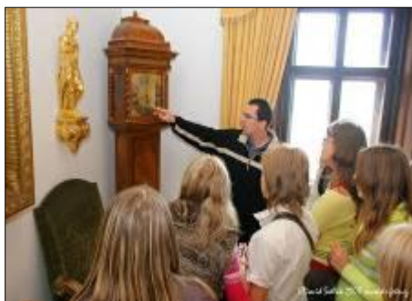
Výstava Hodiny v historických interiérech