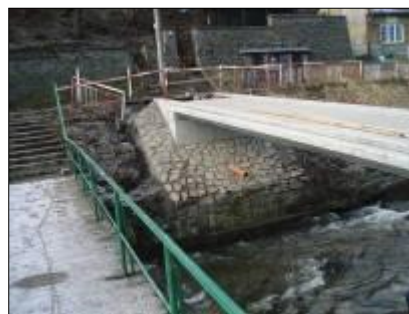
Lávka spojující ulici Barvířskou a Hvězdné údolí - stav před a v průběhu rekonstrukce