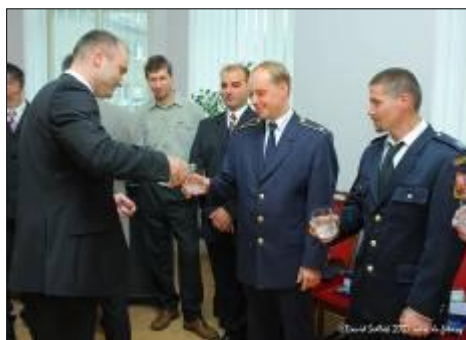
Ministr vnitra ČR Ivan Langer na radnici