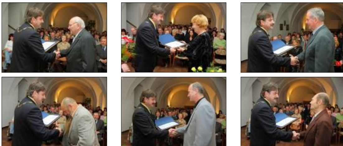
Předání Cen města Šternberka pro rok 2007 - oceněné osobnosti