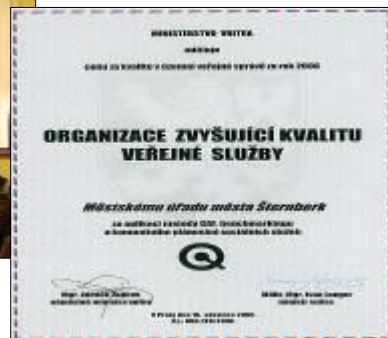
Ocenění za kvalitu veřejné správy