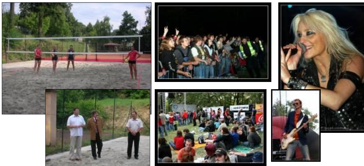
Otevření hřiště na plážový volejbal TJ Sokol

3.8. bylo v areálu TJ Sokol otevřeno již druhé hřiště na plážový volejbal ve Šternberku. 4.8. se konal za rekordní několikatisícové návštěvnosti IV. ročník rockového festivalu Šternberský kopec, jehož hlavní hvězdou byla německá zpěvačka Doro Pesch. 7.8. oslavila privátní mikrobiologická laboratoř ve Šternberku desáté výročí zahájení činnosti. V bývalém augustiniánském klášteře byla obnovena fasáda západního a jihozápadního křídla a upraveny prostory pro expozici města. Městské koupaliště předčasně ukončilo sezónu kvůli úmrtí zaměstnance.