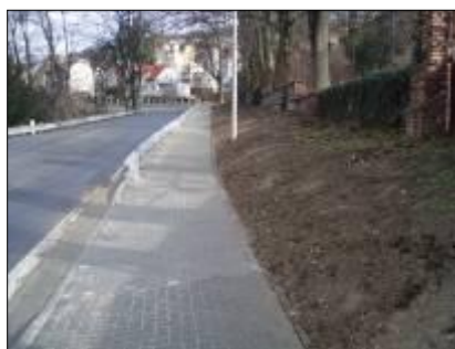
Infrastruktura na ulici Opavská – I.etapa, stav před a po rekonstrukci