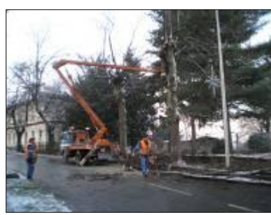
Kácení lipové aleje na ulici Opavská