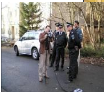
Předání radaru Městské policii Šternberk