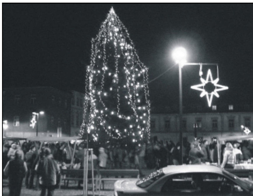
Předvánoční atmosféru u čerstvě rozsvíceného „nového“ vánočního stromu na Hlavním náměstí zachytil objektiv Pavla Zahradníka.