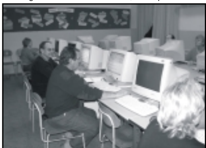
Snímek z počítačového kurzu Okna na ZŠ Svatoplukova.