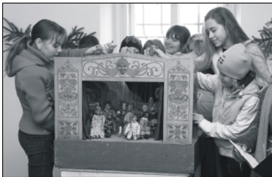
Vánoční loutková výstava, která probíhá na šternberském hradě až do 31. prosince, se setkává se značným ohlasem veřejnosti. Na snímku Davida Sedláka z hradu je loutkové divadlo v podání šternberských gymnazistů.