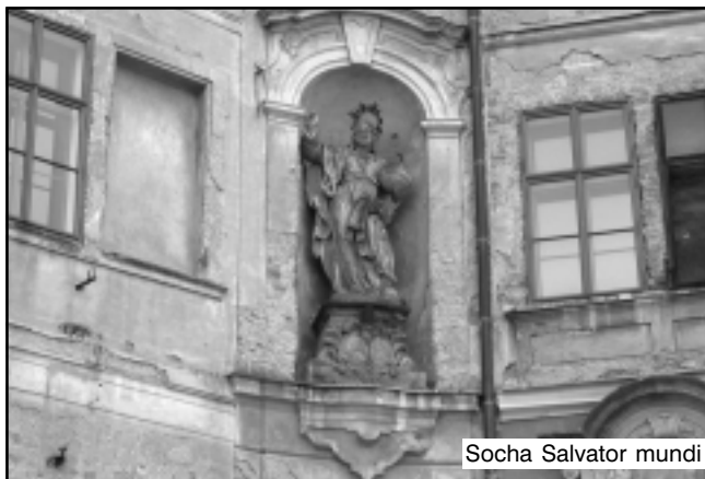
Socha Salvator mundi