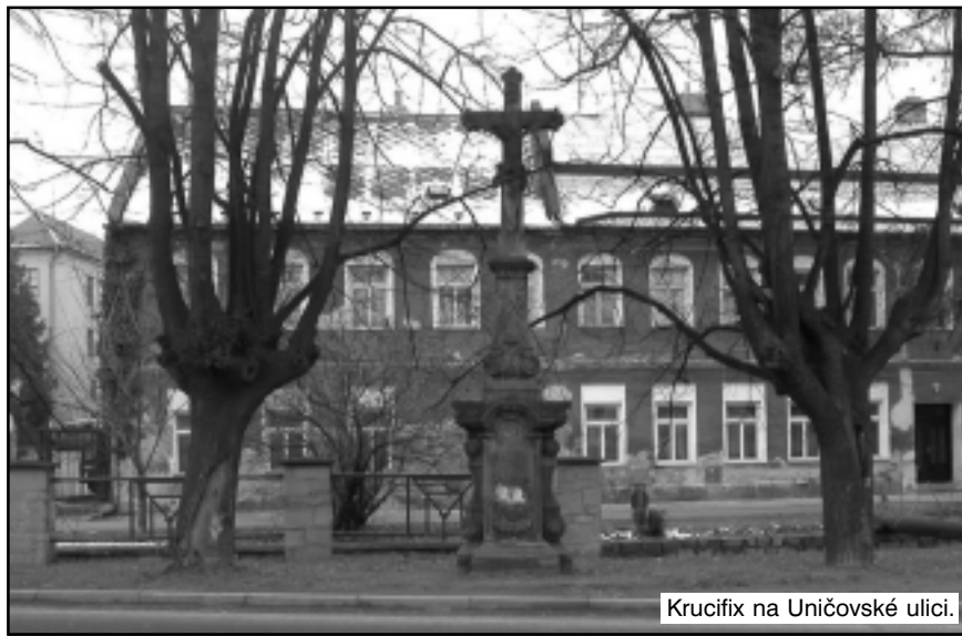
Krucifix na Uničovské ulici.