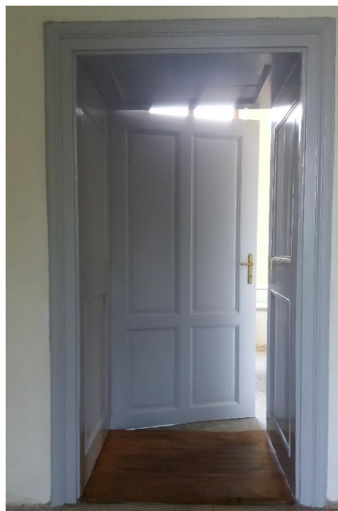
Po obnově dveří: