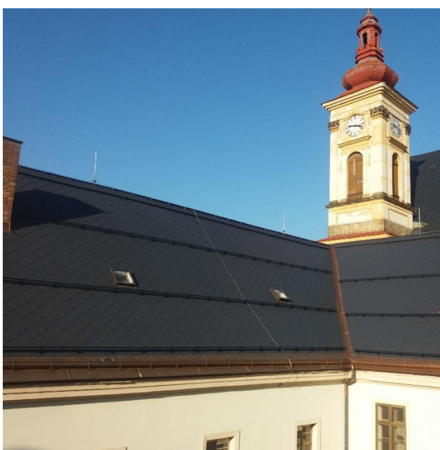
1. etapa obnovy střechy: