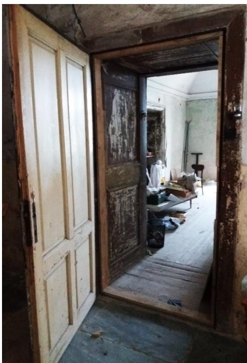
Před obnovou dveří: