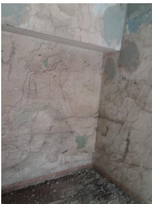
Před obnovou stěn (detail):