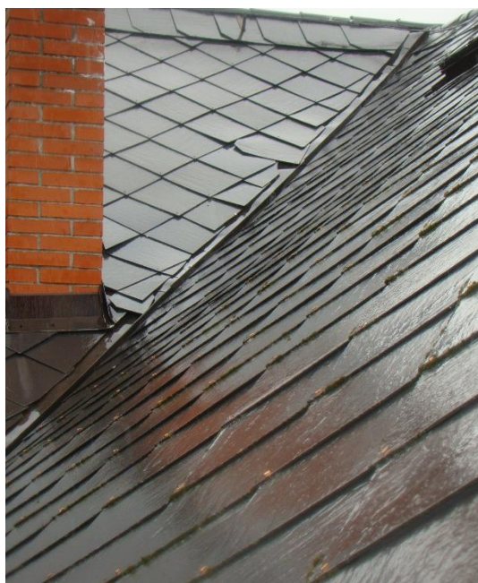
Před zahájením prací na obnově střechy: