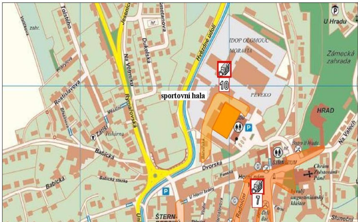
Kamerový bod 10 - Dvorská