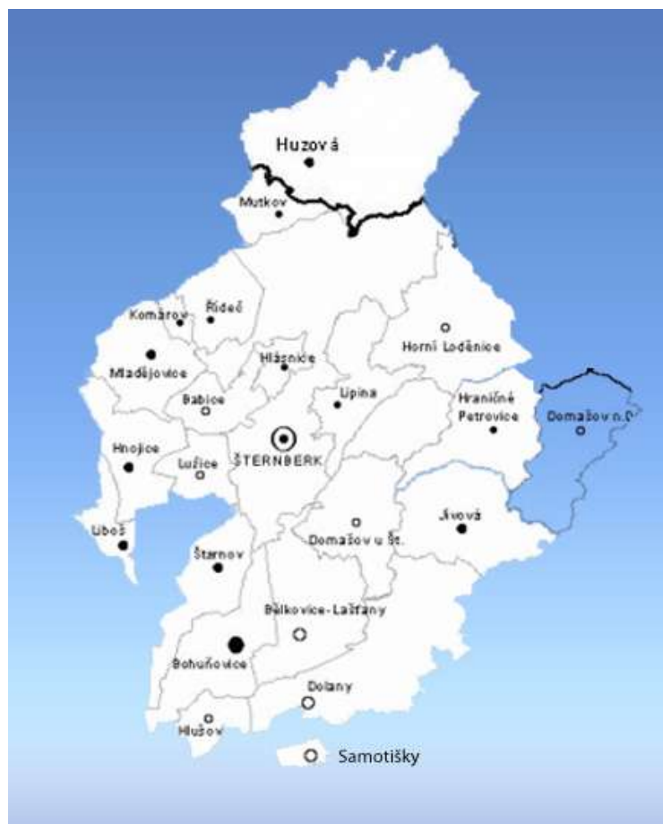
Obrázek č. 1: Mikroregion Šternbersko v kontextu Olomouckého kraje

Z hlediska dopravního spojení je Šternberk vzhledem k blízké poloze města Olomouc důležitým dopravním uzlem na křižovatce silnic I. a II. třídy, mezi městy Olomouc, Opava, Litovel, Uničov, Rýmařov a Bruntál (přehled hlavních silničních spojení viz Územní plán města Šternberk ). Město Šternberk leží na železniční trati Olomouc – Šumperk – Jeseník – Krnov. V Olomouci toto spojení navazuje na trať č. 270 Praha – Česká Třebová – Přerov – Bohumín. Železniční stanice Šternberk včetně přilehlých traťových úseků a celková železniční infrastruktura na území města je stabilizovaným prvkem v území. Hromadnou dopravu, zajišťující spojení Šternberku s příměstskými oblastmi, sousedními městy a celým regionem Olomoucka, zajišťují vedle Českých drah také autobusy společnosti Connex Morava. Pro cyklistickou dopravu jsou ve městě i směrem do příměstských oblastí využívány převážně stávající silnice. V úseku Šternberk – Štarnov je cyklostezka. Podrobné informace o situaci v oblasti cyklistické dopravy ve městě a okolí viz Generel cyklistické dopravy města Šternberk .