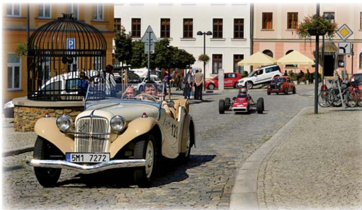
Šternberk | Olomoucký kraj | GPS: 49°43'49"N, 17°17'56"E

Vydalo město Šternberk v roce 2016 u příležitosti 720. výročí od první písemné zmínky o městě www.sternberk.eu